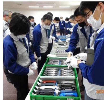
部門横断的チームによる対応の様子